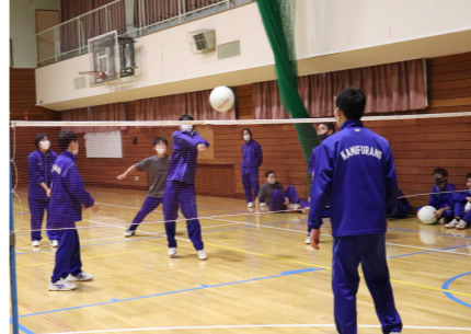
【二年生ミニバレーボール】

十二月十六日(水)から十八日(金)に学年ごとにスポーツレクレーションを実施しました。一年生は、ミニバレーボールとドッジボール。二年生は、障害物競走リレーとドッジボール。三年生は、バレーボールを行いました。積雪で、外体を動かさな