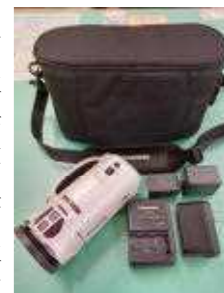
町法人会より寄贈

生徒の活動の記録や授業での活用で、これまでよりも鮮明な映像が撮影できると期待しています。