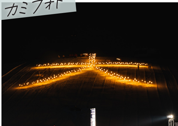
町の年越し恒例イベント「第39回北の大文字」が日の出公園で開催され、約1,000人が来場! 最後には花火も上がり、今年も大盛り上がりでした!