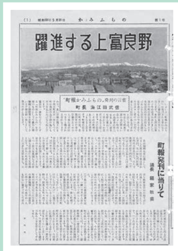
昭和33年5月20日発行の 広報かみふらの第1号