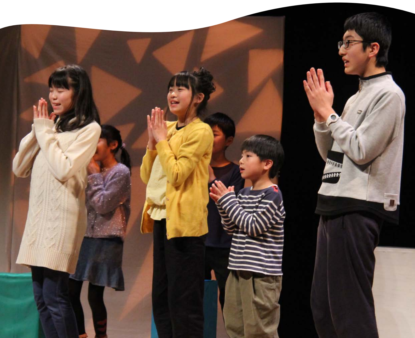
かみふらの演劇祭