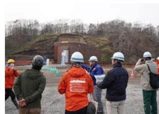
砂防堰堤について解説する 室蘭開発局職員

比較・検討を行い、より豊かな解説やご案内ができるよう事務局一同、引き続き精進してまいります！