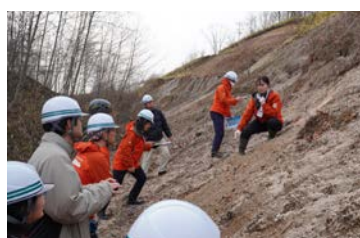
支笏カルデラ形成噴火について 露頭で解説

大規模な火砕流堆積物がなぜ、現在はまだかな丘となっているのか？「十勝カルデラ」は、現在の十勝岳連峰が覆ってしまっているため、その姿を直接目視することはできませんが、「カルデラ」とはそもそもどんなものなのか？そして「カルデラ噴火」とはどのような現象なのだろうか？農業を営む基盤となっているなど、我々の生活に身近な波状丘陵、そして十勝カルデラに対する学びを深めるため、11月25日（火）に「道南の火山を学ぶ」をテーマとして、その噴出物の露出の良さからカルデラ噴火推移が詳細に分かっている支笏カルデラを対象として、富島専門員解説のもと露頭観察やカルデラ周辺の地形について理解を深める野外巡検を行いました。