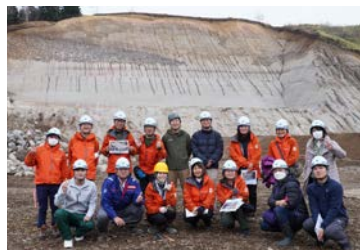
支笏カルデラ大露頭前で集合写真