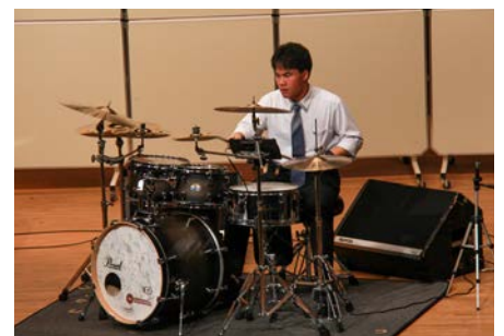
力強い演奏で会場を魅了！