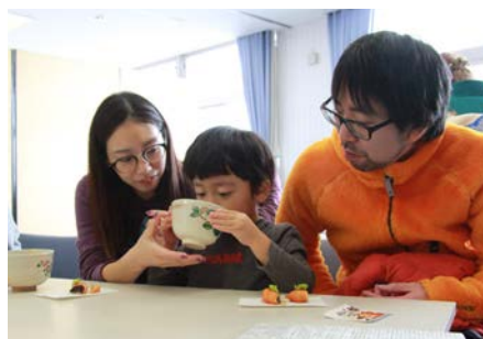
子どもから大人まで楽しく茶道体験