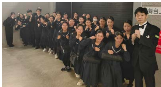
全国大会会場にて

接会うことはなくても応援し てくれたり気にかけていただ いた方々、本番で協力してく れた大会関係者の方々がいた からこそだと思えます。さら に努力を重ねて良い演奏をお 届けすることで、皆さんに感 謝を伝えていきたいです」