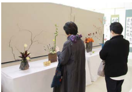
公民館には力作が勢ぞろい