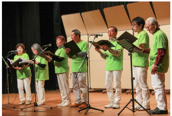
心のこもった美しい歌声を披露

このほか、書道・茶道体験やフリーマーケット、かみふらの軽トラ市による農産物販売などを実施。多くの来場者で賑わい、芸術・文化の秋を楽しんでいました。