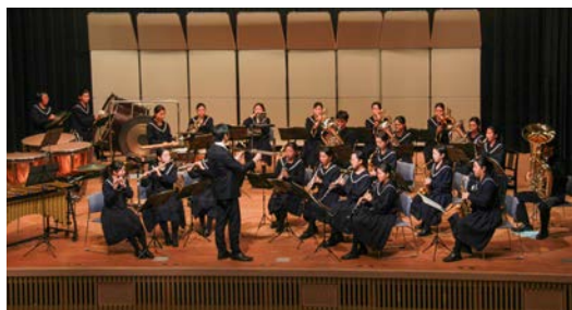
総合文化祭で受賞曲を披露

接会うことはなくても応援し てくれたり気にかけていただ いた方々、本番で協力してく れた大会関係者の方々がいた からこそだと思えます。さら に努力を重ねて良い演奏をお 届けすることで、皆さんに感 謝を伝えていきたいです」