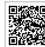
町ホームページ QRコード