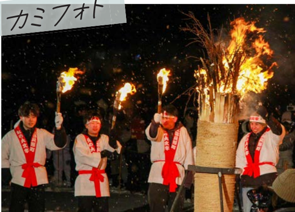
年越しの恒例イベント「第37回北の大文字」が開催。 町と町民の幸せを願い、今年も「大」の字が灯されました