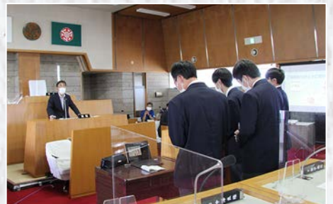
上高生との「町長と語ろう」