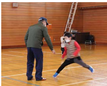
東中小学校での 声掛け対処訓練の様子

こんな時どうする?!! 小学校で防犯教室開催 10月26日に上富良野西小学校、11月9日に東中小学校で防犯教室が開催されました。 不審者に遭遇した時どうすればいいか確認するため、不審者役の警察官が児童に声をかけ誘い出す事例を実践。児童らは誘いの言葉に乗ることなく、きっぱり断り、子ども10番の家に駆け込むことができました。 いざという時のため、子ども10番の家の場所や防犯ブザーが鳴るかの確認、不審者の服装や特徴を覚えておくなど、日ごろからできることを実践しました。