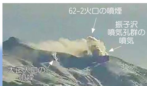
北西側から見た火口周辺の状況