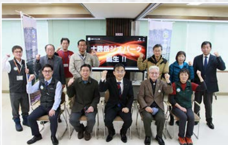
十勝岳ジオパークが誕生

令和5年がさらなる発展の起点となるよう、全身全霊で頑張っておりますので何とぞよろしくお願い申し上げます。新年のあいさつに代えさせていただきます。