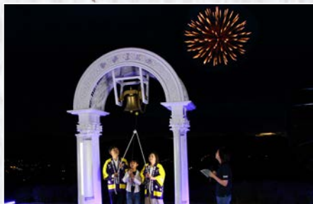
ラベンダーフェスタかみふらの2022