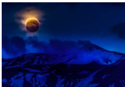
「十勝岳に登る月食」加藤寛満