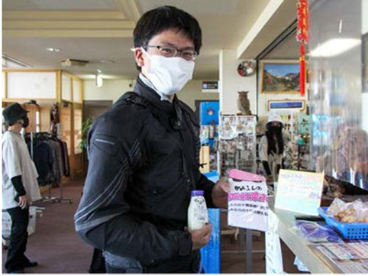
紅葉まつり限定タオルを手にする来場者