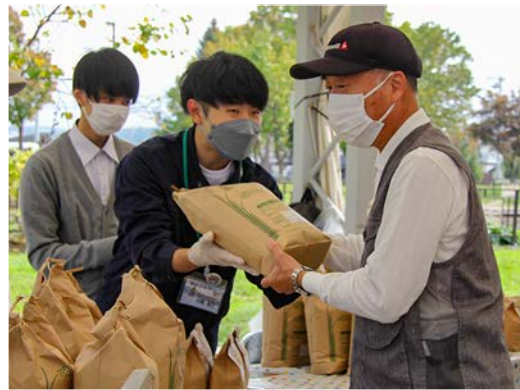
上富良野産の新米を購入する来場者

上富良野中学校1年生を対象に、命の大切さを学ぶ授業が行われました。安心して出産、育児ができる環境づくりと妊娠・出産・子育てに関する正しい知識を深めることを目的に、町の地域小字化対策推進事業として実施されました。 授業では、助産師が妊娠から赤ちゃんが生まれるまでを話した後、生徒たちは実際に妊婦の身体状況を体験できるジャケットを着用したり、胎児の成長過程などを人形で学習しました。重さ約5キロの妊婦体験ジャケットを着けた生徒は「足元が見えないし、動きにくい」と普段通りにいかない妊婦の大変さを体験しました。