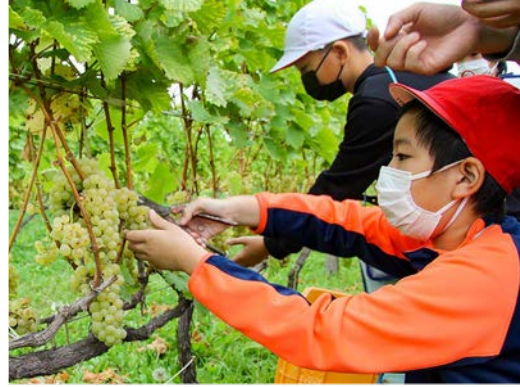
ひと房ずつ丁寧に収穫する児童

かみからの十勝岳紅葉まつりが、十勝岳温泉郷などで開催されました。対象の温泉会場では、施設の利用者に先着でプレゼントが配布され、凌雲閣横にはキッチンカーも登場。訪れた方は色付き始めた山の景色と秋の味覚を満喫していました。 会場の一つ「十勝岳温泉湯元凌雲閣」を利用した神奈川県の男性は「以前にも利用したことがあるが、今日は天気も良く、温泉も景色も素晴らしい」と笑顔で話しました。 2日には、賑わいテントを会場に実施された収穫祭で、誰でも挑戦できる空くじなしの抽選会が行われ、こちらも多くの人で賑わいました。