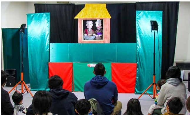
おじいさんとおばあさんの話に聞き入る親子連れ

会場では、読み聞かせ団体による読み聞かせ、クレヨンカンパニーによる「いろいろ劇場」と題した身近な廃品を利用したからくた人形の劇や影絵を公演。多くの子どもや親子連れが楽しんで過ごしました。