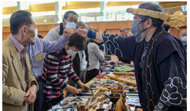
道具の目的、使い方などを手に取り学習する参加者