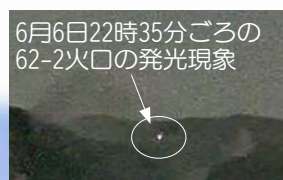
6月6日22時35分ごろの62-2火口の発光現象