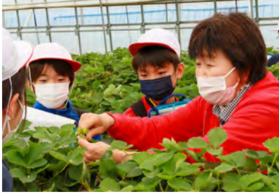
イチゴに児童も興味津々