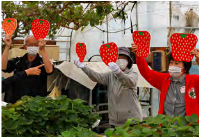
どのイチゴが甘いかな？