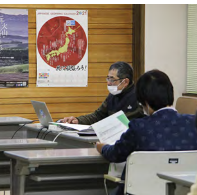
サポーター養成講座の様子