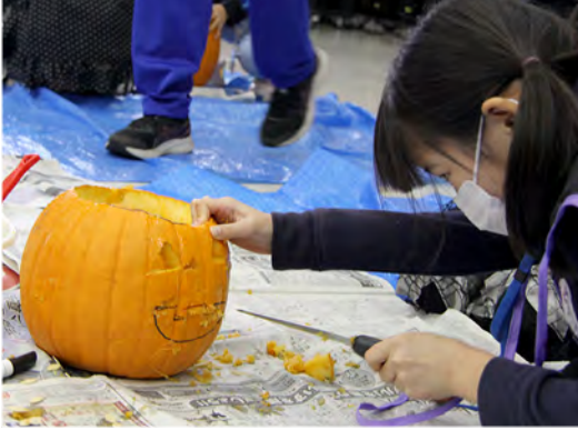
顔を切り抜く作業は真剣そのもの！