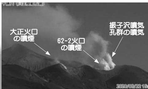
北西側から見た火口周辺の状況

火山活動による傾斜変動は観測されていません。GNSS連続観測とGNSS繰り返し観測では、2017年秋ごろから山体浅部の収縮を示す変動を観測。収縮を示す変動量は小さいため、山体浅部が膨張した状態は維持していると考えられます。深部へのマグマの供給によると考えられる地殻変動は認められません。