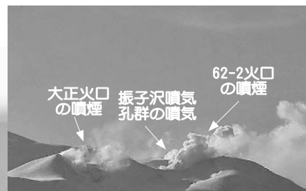
北西側から見た火口周辺の状況