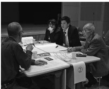
かみふの将来を熱く語り合う