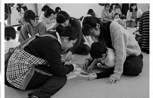
12/11 子どもセンタークリスマス会。親子でツリーオーナメントを作ったほか、歌を歌い楽しみました。