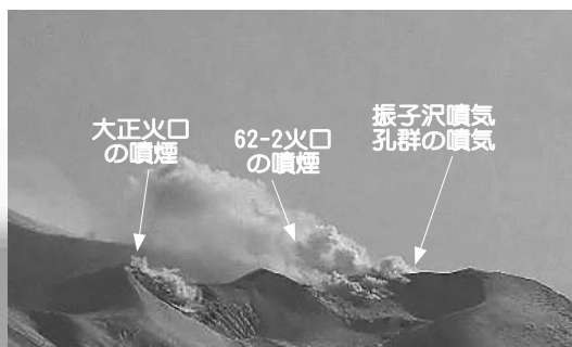
北西側から見た火口周辺の状況