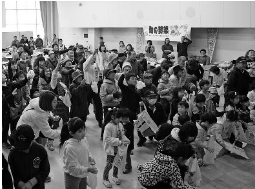
もちまき大会のもち米も地元産！