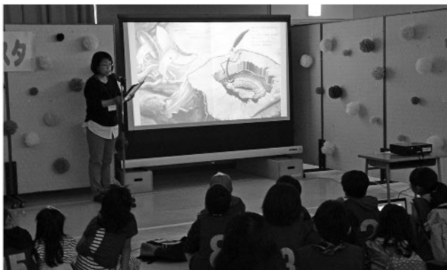
スクリーンを使った読み聞かせに聞き入る子どもたち

講師からはベビーマッサージの効果として、心身が安らぐだけでなく「オキシトシン」というホルモンの分泌が促されるため、免疫力や自然治癒力が高まると説明されました。参加者の中には、実技が終わると早速効果があったのか、ぐっすり眠る子ども。親からは「子どもの機嫌がよいつきは見守っていることが多かったが、これからは意識してふれあうようにしたい」と感想が聞かれました。