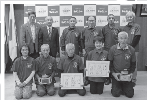
10/17 フロアカーリング協会の皆さんが来庁。13日に行われた全国交流大会で優勝しました。