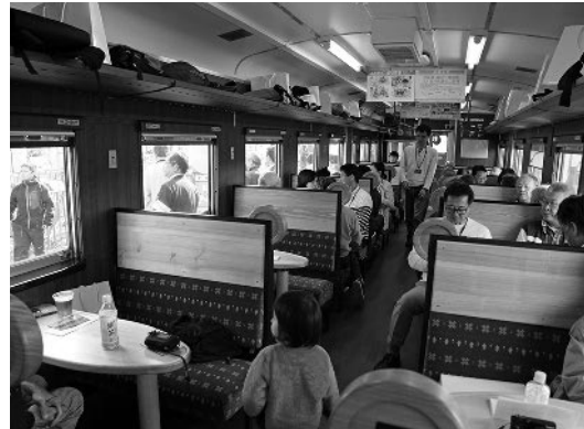
道産木材がふんだんに使用された紫水号の車内

かみふらの収穫祭2019が公民館で行われ、約800人が来場しました。地元の農産物の販売や詰め放題のほか、三重県津市「朝津味」のサトイモやミカンも販売されました。また、もちまき大会やジャガイモ横みなどのイベントは大盛況で、商工会青年部が企画した「まるかみ製麺」では、地元産小麦「きたほなみ」を使っただうどんを提供。来場者からは「地元産は特別においしく感じます」と満足の声が聞かれました。17時からのビアホールでは、地元産ホップが使用されたビールなど数種類が用意され、飲み比べを楽しむ姿も見られました。