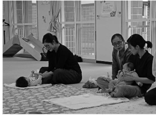
親子とも楽しみながら行うことが重要