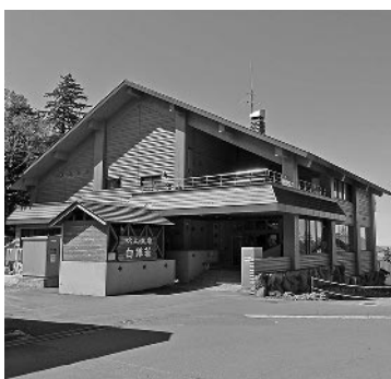
日頃の疲れも癒やされますよ