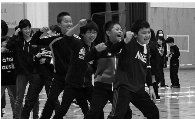
笑顔でジェスチャーゲームに取り組む小学生

参加児童は「高校生が優しく教えてくれて、楽しく英語の学習ができた」と話していました。