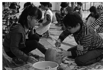
グループごとに協力しながら制作

10月14日の「鉄道の日」に合わせ、上富良野駅では開駅当時の写真が展示されたほか、展示写真から出題されるクイズに回答して景品が当たるイベントや「ご当地キャラミッション 鉄道でGO」が行われました。この日は、特別観光列車「紫水号」がお披露目され、旭川ー富良野間を往復運行しました。上富良野駅には多くの見物人が集まり、上富良野駐屯地太鼓同好会紫彩太鼓による「北海道四季打太鼓」で列車を迎えたほか、地元産ホップと大麦を使用した「まるごとかみふらの」を販売。乗客は「おいしいビールもいただき、特別な1日となりました」と話していました。