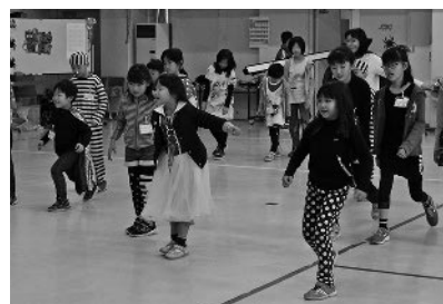
「What time is it Mr.wolf?」ゲーム