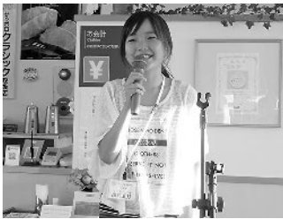
緊張しながら自己紹介

もたちは植物などから抽出した色が使用されていることに驚いていました。ふらの Grill での夕食会お互いに自己紹介をした後、宿舎の白銀荘で交流会を行いました。交流会では「人間のゲームやプール遊びで、打ち解けていました。」