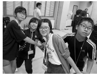
白銀荘で仲良く宿泊♪