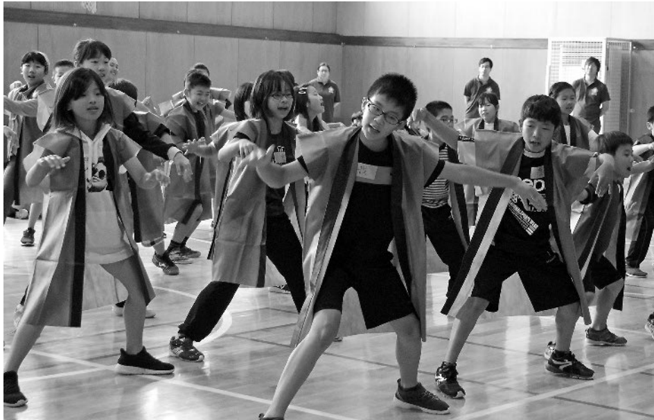
4~6年生が元気いっぱい披露した「西小ソーラン」

白銀荘を出発し、8時に西小学校に到着。校内の見学では「体育館まで廊下が続いている」「天文台がある」など安東小学校との違いに驚いていました。体育館での全体交流会では、西小児童が花のアーチと拍手でお出迎え。安東小児童は自己紹介の後、自分たちの学校のほか、名物の津ぎよつぎなど三