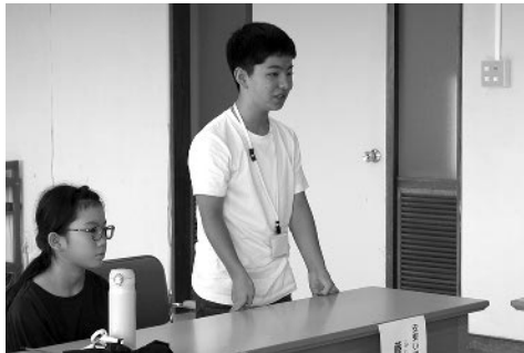
向山町長に鋭い質問も

重原や津市について紹介しました。西小児童からは4~6年生が「西小ソーラン」を元気に披露。続いて児童会による交流ゲーム「じゃんけん列車」で全員が盛り上がりました。5年生から「ラベンダーブーケ」が安東小児童へプレゼントされた後は、学年ごとに分かれて授業を受け、給食も一緒に食べました。