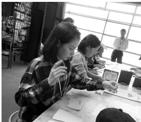
「押し花プレート」作りに挑戦！

その後、ファーム富田の見学を終えた一行は、ホームステイ先の家族と対面し、それぞれのホームステイ先へと向かいました。