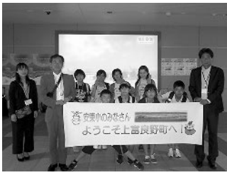
旭川空港に到着した一行