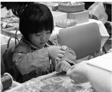
体験コーナーもあるよ♪