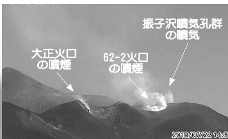
北西側から見た火口周辺の状況

大正火口の噴煙の高さは2010年ごろから、振子沢噴気孔群の噴気の高さは昨年4月ごろからやや高い状態が続いています。