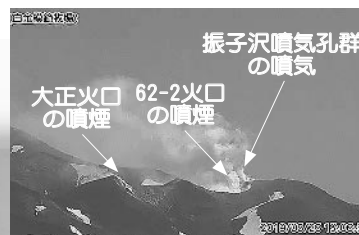
北西側から見た火口の状況

監視カメラによる観測では、62・2火口の噴煙の高さは火口縁上おおむね200m以下、大正火口と振子沢噴気孔群の噴煙、噴煙の高さはおおむね100m以下で経過。大正火口の噴煙の高さは2010年ごろから、振子沢噴気孔群の噴煙の高さは昨年4月ごろからやや高い状態です。