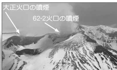
十勝岳西側から見た火口の状況

62・2火口とその周辺では、熱活動のやや高い状態が継続していると考えられます。監視カメラによる観測では、62・2火口の噴煙の高さは火口縁上300m以下、大正火口の噴煙の高さは200m以下、振り沢噴気孔群の噴煙の高さは100m以下で経過しました。大正火口の噴煙の高さは2010年ごろから、振り沢噴気孔群の噴煙の高さは昨年4月ごろからやや高い状態です。