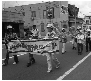
一昨年のパレードの様子

行進経路 多田精肉店↓道道 上富良野消防署(約1.4km) ※悪天候の場合は中止します 問合せ 上富良野消防署 ☎2119