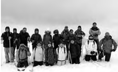
到着地点の二段目で記念撮影！