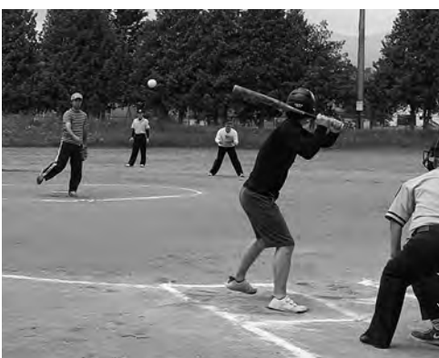
住民会対抗ソフトボール大会(島津球場)

する中で、町民一人ひとりに生涯にわたって自主的に学ぶ機会を提供し、町社会教育基本方針に掲げる「生涯学習活動の充実と人を育む環境づくりの推進」「健康づくりのためのスポーツ活動の推進」「心の豊かさを育む文化・芸術活動の推進」に向けた取り組みを進めます。今年度から「第9次社会教育中期計画」に掲げる6領域8分野17項目の施策に基づき、家庭、学校、地域社会、それぞれが持つ教育機能の充