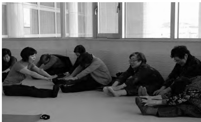
無理せずに、前屈は伸ばせるところまで！

参加者は「身体がほぐれて柔らかくなっているように感じた。今後も続けていきたい」と話していました。