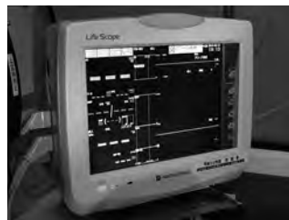
ベッドサイドモニター

用ベッド サイドモニター ニターや 半自動除細動器を 更新しました。防衛省による「特定防衛施設周辺整備調整交付金」を活用し整備されたもので、これまでの資機材と比べると、モニターの視認性や操作性などの性能が向上しています。