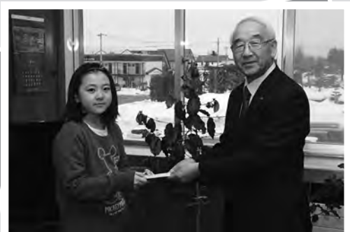
3/11 ベンチャーキッズに参加した児童7人が来町。向山町長へ商品販売で得た収益金が手渡されました。

人口 10,639人 (-125) 男 5,442人 (-57) 女 5,197人 (-68) 世帯 5,300世帯 (-41)