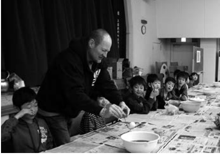
イースターエッグづくり♪