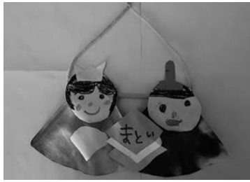
作品名 「おひなさま」

お友達と相談しながら作り、服の飾りを切ることが難しかったけど、男の子の服は好きな青色でかっこよくできました!! 家に飾るのが楽しみだそうです☆