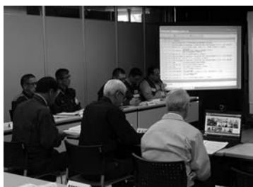
関係機関との会議