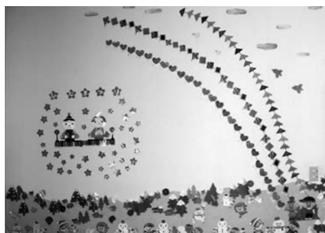
さまざまな色紙できれいな飾りに

「ちよこっとした趣味、特技」を募集しています! 町民生活課自治推進班 ☎6985