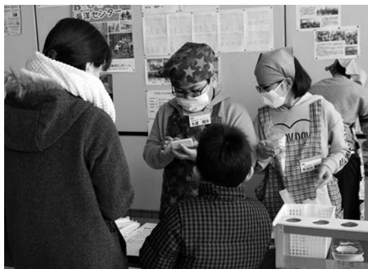
商品と合計金額をきちんと確認