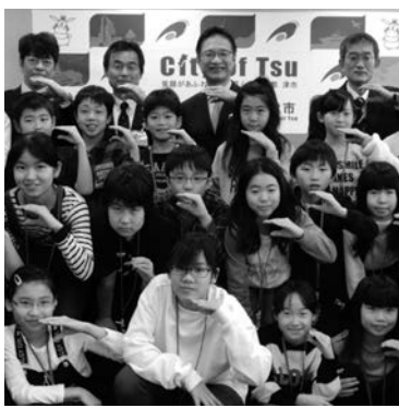
前葉市長(上段中央)と一緒に「つ」のポーズ

まずは津市役所を訪問し、前葉泰幸市長と懇談。津市の概要や津市と上富良野町を結ぶ歴史についての説明を受けました。