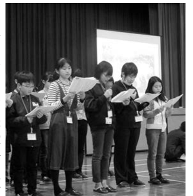
紙芝居を朗読する児童たち

次に訪れたのは、上富良野西小学校と姉妹校提携し、町とも縁の深い安東小学校。体育館で児童のアーチと盛大