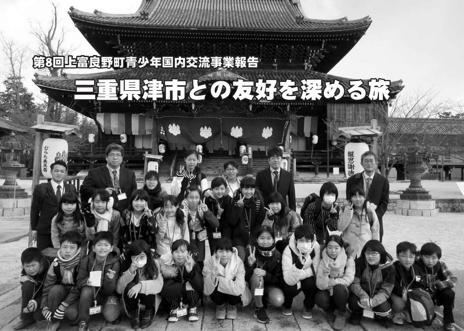
専修寺の御影堂前にて

「飛行機に乗るのは初めて!」との児童もいる中、一行は不安と期待を胸に上富良野町を出発! 飛行機、高速船と乗り継ぎ、かみひのルートである三重団体のふるさと、津市に到着。津なぎさまちでは、津市教育委員会と安東小学校の皆さんの歓迎を受け1日目が終わりました。