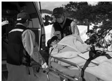
要支援者の輸送訓練

2/21 災害に備えて 十勝岳噴火防災訓練 2月20～21日の2日間、融雪型の火山泥流災害を想定した防災訓練が行われました。 20日は災害対策本部の設置、各関係機関との連絡調整会議が行われ、21日は自衛隊や消防などによる要支援者の輸送訓練のほか、12時50分ごろに噴火警戒レベル5に引き上げられたことを受け、全町に避難指示が出されると住民が各指定避難所に避難を開始。消防団や自衛隊、警察が担当地区を巡り未避難者の確認・捜索を行いました。