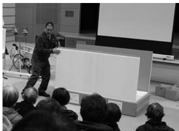
簡易ベッドの組み立ての実演