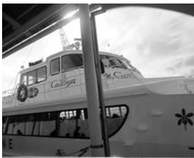
高速船に乗って津市へ

「飛行機に乗るのは初めて!」との児童もいる中、一行は不安と期待を胸に上富良野町を出発! 飛行機、高速船と乗り継ぎ、かみひのルートである三重団体のふるさと、津市に到着。津なぎさまちでは、津市教育委員会と安東小学校の皆さんの歓迎を受け1日目が終わりました。