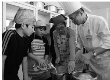
災害食の作り方を学ぶ児童