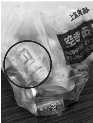
②次に空き缶の指定袋に入れる

※詳しくは町のホームページをご覧ください かみふらの2月25日号に同封しましたごみカレンダーをご覧ください