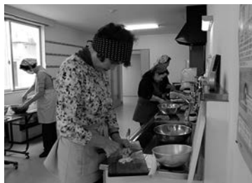
女性防火クラブによる炊き出し