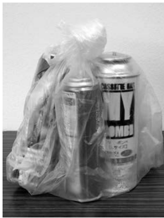
①まずは穴を開けずに中身の見える袋に入れる