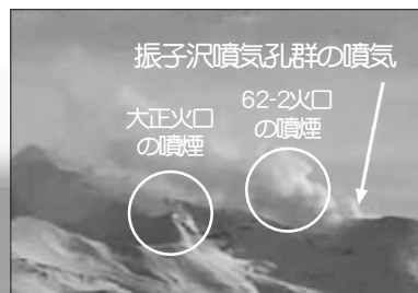
十勝岳北西側から見た火口の状況