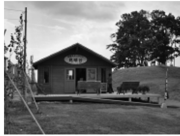
見晴台情報ステーション

【指定管理者】 一般社団法人 かみふらの十勝岳観光協会 (中町1丁目1番80号) 問合せ 総務課総務班 ☎6400