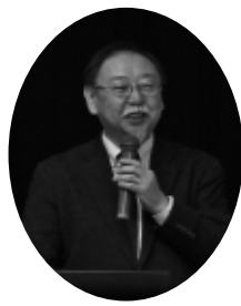
◎コーディネーター

地域社会の現場でフィールドワークを中心としたまちづくりコーディネーター業を長く営んできた経験をベースに、近年の地域活性化のあり方、地域環境に合った地域再生計画づくりと計画実現の効果的手法について調査・研究を重ねる。