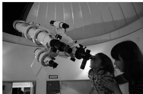
口径20cmの大きな望遠鏡があるよ！