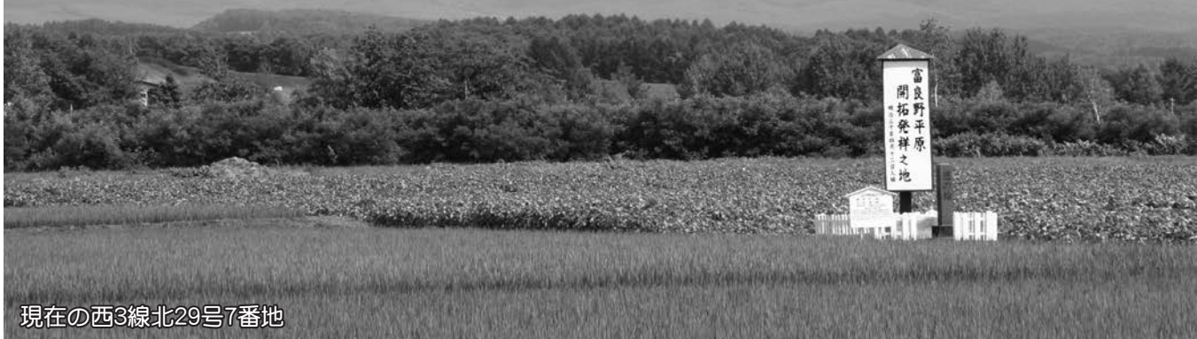
現在の西3線北29号7番地