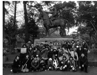
前回の交流事業での1コマ