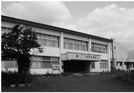
現在の旧東中中学校