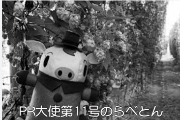
PR大使第11号のらべとん

上富良野の素晴らしさ、魅力を積極的に広く宣伝していただける「かみふらのPR大使」を随時募集しています。 対象者 町にゆかりのある方(現在の居住地、出身地は問いません) 任期 2年