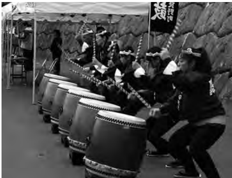
十勝岳山開きで山の安全を願う演奏する保存会の皆さん