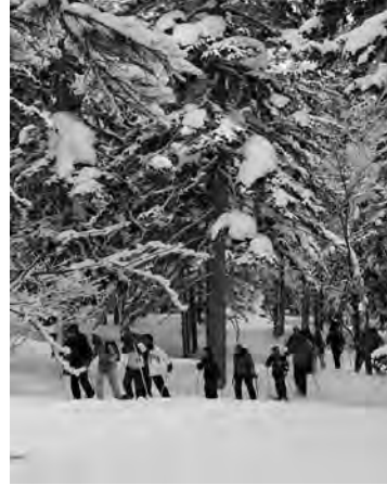
昨年のかんじきツアー