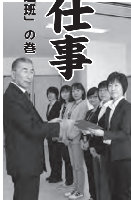
全員カメラ目線で行われた(!?)先月の表彰式