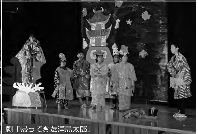
劇「帰ってきた浦島太郎」