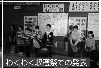
わくわく収穫祭での発表