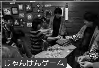
じゃんけんゲーム