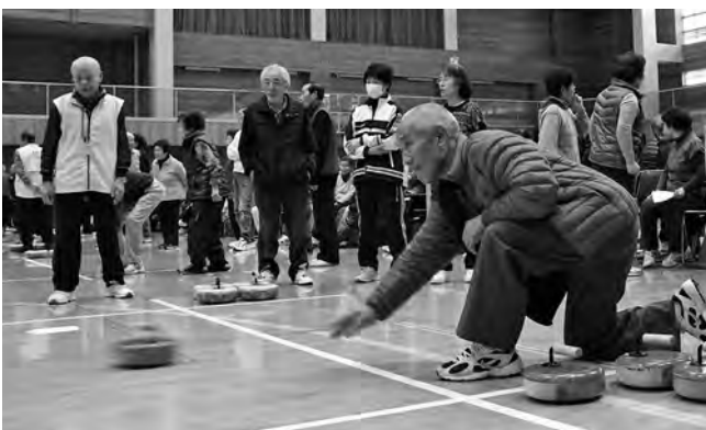
「ターゲット」を狙って、気合の一投!

第6回住民会対抗フロアカーリング大会が社会教育総合センターで行われ、17住民会から過去最多の38チーム、178人が参加しました。キャスター付きの「フロッカー」を転がし、「ターゲット」に近いほど高い点数が入るルールのため大逆転の可能性もあり、最後まで油断は禁物。参加者は気合が入ったシヨットを見せ、「変な所に行くな〜」「いいぞ、そのまま!」など、会場からは一投ごとに歓声が上がっていました。【優勝】栄町住民会チーム