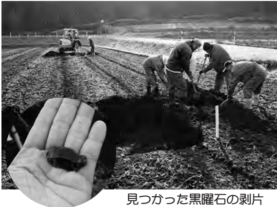
見つかった黒曜石の剥片