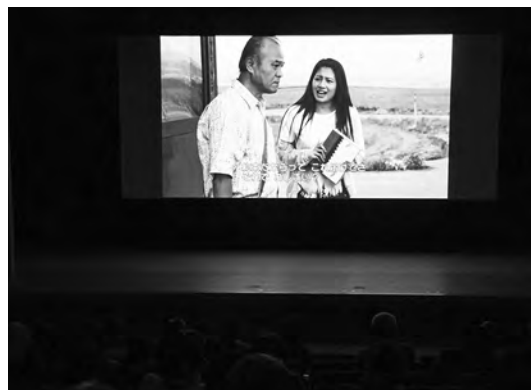
企画・主演の俳優 大地康雄さん(左)