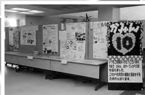
町内の福祉事業所(10カ所)の活動をご紹介します！ ～保健福祉総合センターかみん10周年記念展示～

住民登録 人口 11,267人 (-34) 男 5,670人 (-12) 女 5,597人 (-22) 世帯 5,224世帯 (-5) 外国人住民 ※住民登録の内数 人口 26人 (-5) 男 9人 (-3) 女 17人 (-2) 世帯 16世帯 (-2)