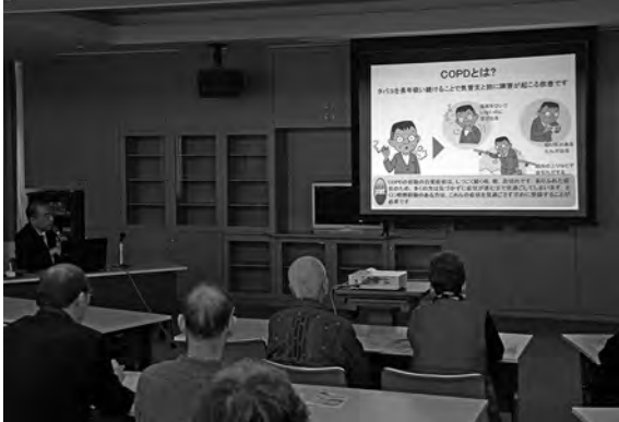
COPDセンター長でもある武田部長が病気を説明

町の特定健診では今年度から「肺機能検査」を追加し、COPDの早期発見に取り組んでいます。