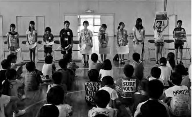
交歓会では緊張しながらも上富良野町を紹介

私が三重県に行つての第一印象は、北海道と三重県の街が違うことです。三重県の街には見たことのない木がずらりと並んであり、とても不思議な気持ちになりました。それと、北海道と三重県のしゃべり方が違いとても違和感がありました。 安東小との交流で、とても楽しかったことが2つあります。