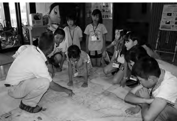
昔の北海道地図でお勉強(松浦武四郎記念館)