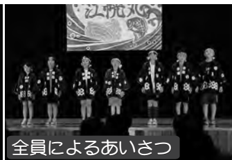
全員によるあいさつ