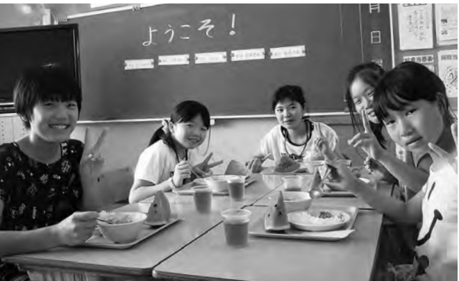
安東小のお友達と楽しく給食を食べました～♪