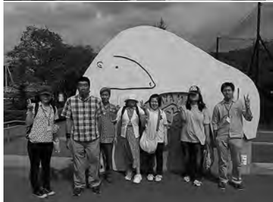
8月にはレクリエーションで旭山動物園へ。楽しかったあ〜(o)/

る児童と、高齢者など地域の方との交流をはじめ、サークル活動、研修会などでの利用も企画していきたいと考えていますので、皆さんから気軽にアイデアやアドバイスをいただければと思います。