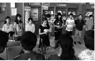
いよいよお別れの時…

まず1つ目は、モーターボートに乗ったことです。もっと大きな船かなあつと思つていただけ、実際小さく、とても水しぶきがかり、とても気持ちよくて楽しかったです。 2つ目は、ホームステイでスイカ割りやバーベキュー、花火をしたことです。夕食では、津ギョウザを食べました。とても大きく、パリパリしておいしいかったです。