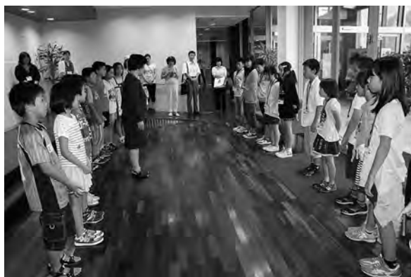
なごさまちでは安東小のみんながお出迎え