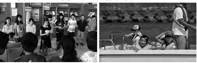
モーターボート体験