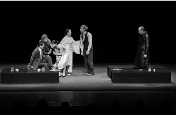
それぞれの思い、事情を抱えながらも「生きる」

北海道舞台塾ふらのの事業、富良野塾 OBUユニットによる演劇「みずのかけら」が、保健福祉総合センターかみんで上演されました。 北海道と富良野沿線5市町村で運営する同事業は、町内では総合文化祭の開催に合わせて行っており、毎年新たな脚本が書き下ろされます。 父、母、娘、息子の4人家族の何気ない日常。そこに突然起こったある出来事。現実と非現実を絶妙に交差させながら進行するコミカルな状況設定と、「家族とは…」を問うシリアスなストーリーに、公演後には会場から大きな拍手が起っていました。