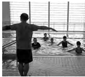
アクアビクスの様子