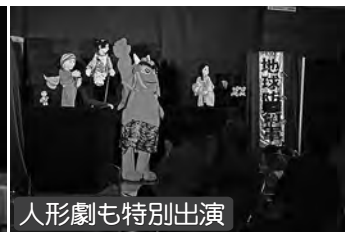
人形劇も特別出演