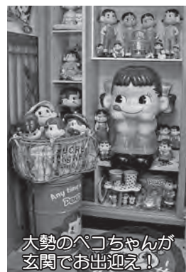
大勢のペコちゃんが玄関でお出迎え!