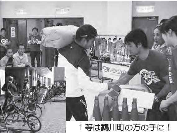
1等は鶴川町の方の手に！

上富良野町商工会による地域商店街活性化事業「まるごと！ かみふらのタウンライド ～ニニコニコペダル～」が行われました。