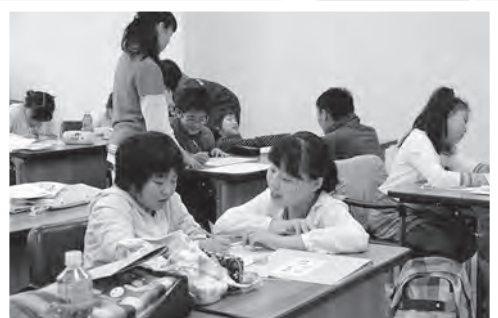
10/4 土曜日の「ちょこっと学習」。北海道教育大学のお兄さんとお姉さんも、教えに来てくれました!