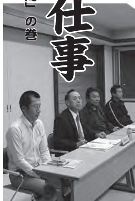
北越事務局長(左から2人目)の説明

町議会の推薦を受け、町長が選任した4人の委員で構成。その事務局として役場職員2人が配置され、会長の指示の下で事務に当たっています。 委員会だけが行うことができる法令に基づく必須の業務としては、農地の売買や貸借など権利移動についての許可、知事が許可権限を持つ農地転用(農地を宅地にするなど)の申請に対する意見具申、遊休化している農地の所有者に対する利用意向調査などがあり、これらはすべて委員や事務局が現地調査を行ったうえで決定されます。