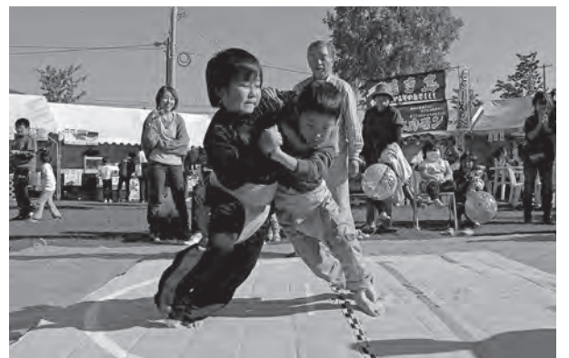
男子の部は力が入った熱戦が繰り広げられました

12日には男女の部に分かれての「ちびっ子すもも大会」が開かれ、体の小さな子が大きな子に負けじと向かって行く姿に、会場からは「頑張れ！」と熱い声援が上がっていました。