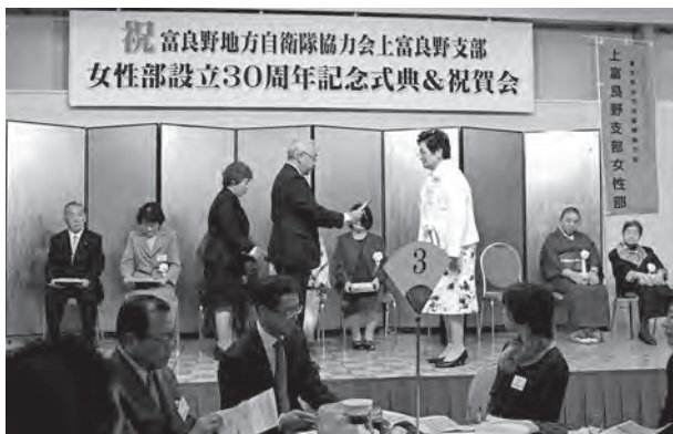
感謝状が贈られる村上女性部長

式典ではこれまでにご功労のあった 方々に感謝状が贈られ、記念すべき節 目の年を盛大に祝いました。