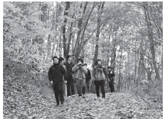
落ち葉が敷き詰められた秋の道を歩く