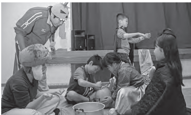
力と頭(!?)を合わせてお化けかぼちゃづくり！

そのほかにも、友だちにトイレットペーパーを巻いてミイラにするゲームや、お菓子の入ったくす玉を棒で割る「ピニャータ」など、ハロウィンにちなんだゲームを楽しみました。