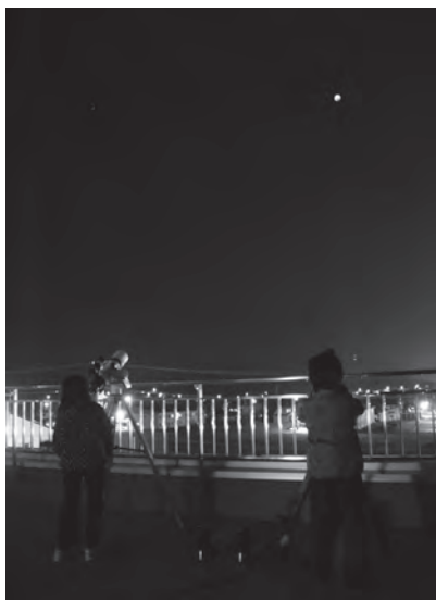
望遠鏡で観察する子どもたち

上富良野西小学校チャレンジ天文台 で、天体観望会が行われました。 この日は太陽・地球・月が一直線に 並び皆既月食。町内だけでなく富良野