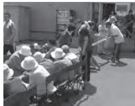
夏には流しそうめん♪

は、自分たちが作ったコーヒーやキャンドルを多くの方に知っていたたく貴重な機会であり、日々の頑張りを認めてもらえることが、利用者の皆さんにとっても大きな励みになっています。