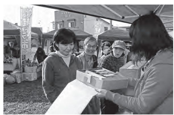
出ました1等「かみふらのセット」！

東中地区の多田農園で「小さなワインまつり」が開かれ、4回目となる今年には札幌や旭川など道内はもとより、遠くは東京からも絶品のワインを楽しむもつと約50人が訪れました。 敷地内で取れた干両梨からその場でつくるフレッシュジュースや、レンガの釜で焼いた特製のおやきなどが振る舞われたほか、ワイン用ブドウ畑の見学やぶどうの試食、チエロと「アノのミニライブ」なども。 同園のワインは、自家製のブドウを100%使用。十勝岳連峰を一望できる屋外の飲食スペースでは秋晴れの青空の下、雪を頂いた山並みを眺めながら、かみふらの味がグユグユッと詰まったワイングラスを傾けていました。