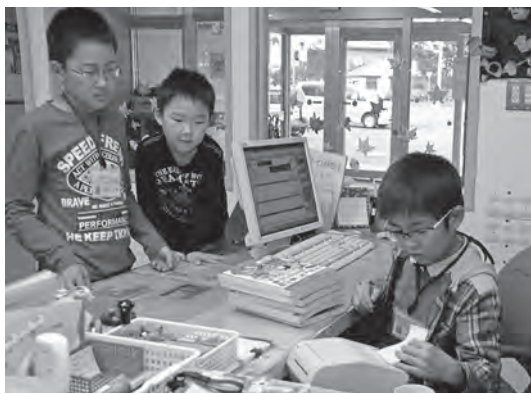
真剣な表情でレシートを印刷するちびっ子職員

約1千冊もの図書館の古本が無料で もらえる「本のリサイクル」をお目当 てに、会場の公民館には開場前からた くさんの人が詰めかけていました。