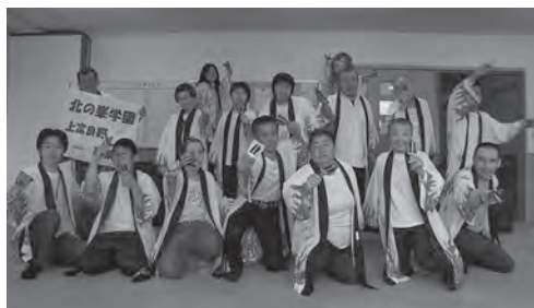
お花見会でよさこいを披露。イエーイ！

何だか食べてばかりのようですが、ふれあい広場など町内イベントへの参加や、当事業所で開催した合同作品展花フェア(など)では、多くの町民の皆さんにお会いすることができました。このようなイベント