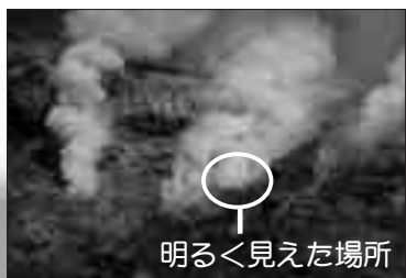
明るく見えた場所

GPS連続観測およびGPS繰り返し観測では2006年以降、62・2火口浅部の膨張を示すと考えられる変動が認められています。より深部へのマグマの供給によると考えられる地殻変動は認められませんでした。