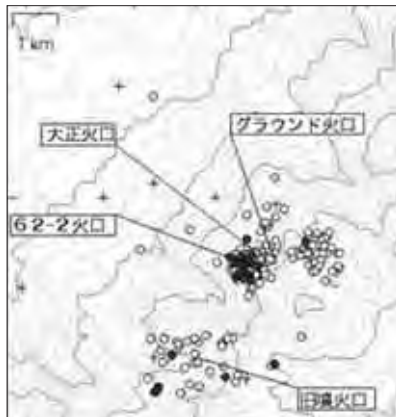
十勝岳の火山性地震の震源分布 ○印: 2012年2月～2013年1月の震源 ●印: 2013年2月の震源

震源は62・2火口付近の浅いところのほか、グラウンド火口周辺や旧噴火口付近の浅いところに分布しました。火山性微動は観測されませんでした。