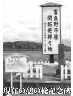
現在の憩の榦記念碑

この機会に、先人の労苦をしのび、たたえ、感謝するとともに、積み重ねてきた116年間の歴史に思いをはせてみてはいかがでしょうか。