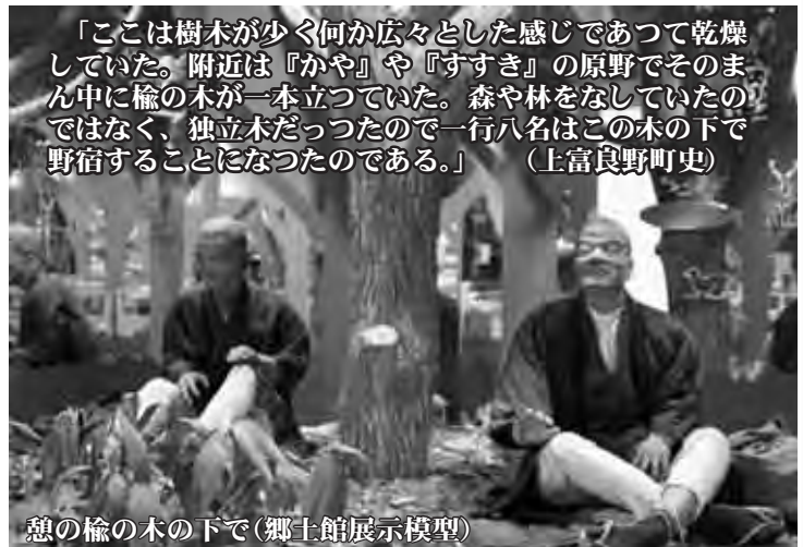
憩の榦の木の下で(郷土館展示模型)