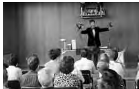
8月3日 道民レクリエーション連携講座「マジック鑑賞」