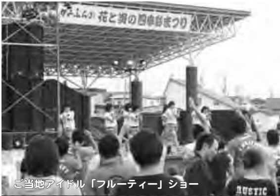
ご当地アイドル「フルティー」ショー

日が落ちると、大小14基の行灯が威勢のいい掛け声とともに町内を練り歩き、クライマックスは花火大会。3千発の花火が、夏の夜空を彩りました。