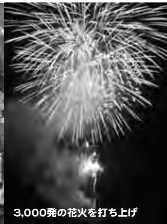
3,000発の花火を打ち上げ