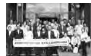
津市民訪問団一行(7月13日)

提携15周年にあたる今年は、7月12日から14日までの3日間、津市民訪問団一行20人が来町し町長を表敬訪問。開拓からの歴史と津市とのつながりについて説明を受