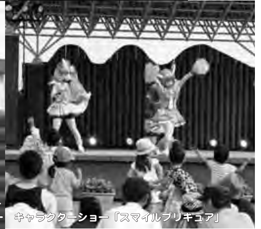
キャラクターショー「スマイルプリキュア」