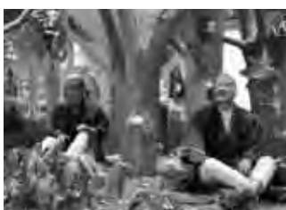
楡の木の下で(郷土館展示模型)

「ここは樹木が少く何か広々とした 感じであつて乾燥していた。附近は 『かや』や『すすき』の原野でそのま んに楡の木が一本立つていた。森や 林をなしていたのではなく、独立木だ つたので一行八名はこの木の下で野宿 することになつたのである。」(上富良 野町史)