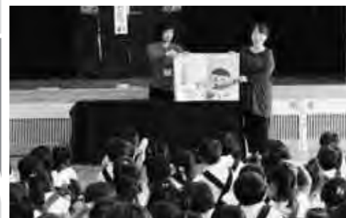
7月18日「本とあそぼう全国訪問おはなし隊」が高田幼稚園に。15,000回目を記念して、絵本「もったいないばあさん」の作者 真珠まりこさん(写真右)も来園し、自作の読み聞かせをしてくれました。

人口 11,718人 (-5) 男 5,889人 (-9) 女 5,829人 (+4) 世帯 5,284世帯 (-14)