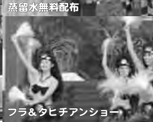
フラ&タチアンショー