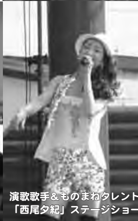
演歌歌手&ものまねタレント「西尾夕紀」ステージショー