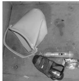
・バケツ ・懐中電灯 ・サンダル・缶 ・懐中電灯の中の電池

●バケツ・懐中電灯・サンダル ↓【不燃ごみ】 ●懐中電灯の中の電池 ↓【電池】 ●缶 ↓【空き缶】