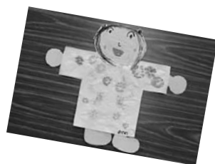
『たたき染めTシャツ』