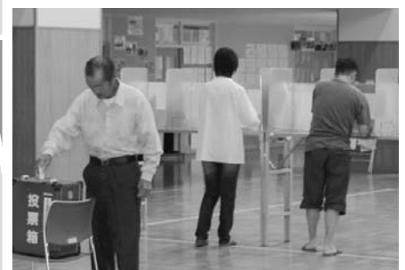
8月14日 上富良野町議会議員選挙投票会場

人口 11,825人 (+ 4) 男 5,965人 (+ 5) 女 5,860人 (- 1) 世帯 5,318世帯 (- 9)