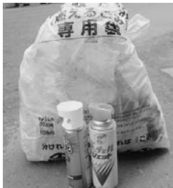
・スプレー缶 ・カセットボンベ

●バケツ・懐中電灯・サンダル ↓【不燃ごみ】 ●懐中電灯の中の電池 ↓【電池】 ●缶 ↓【空き缶】