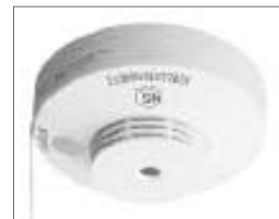
住宅用火災警報器の設置期限は平成23年5月31日までです。

永年にわたり防衛業務に従事され、その職務を果たし、功労を積み重ねた功績により、瑞宝双光章を受章されました。