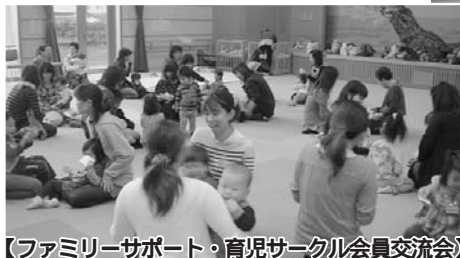
【ファミリーサポート・育児サークル会員交流会】