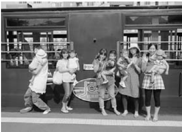
【ノロッコ号に乗ろう】