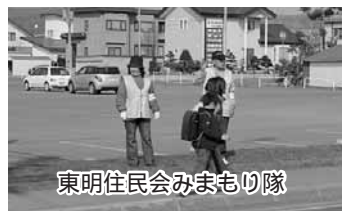
東明住民会みまもり隊

また、車両による巡回パトロールの実施や、これに合わせて独居老人への声かけ訪問を行っています。