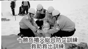
十勝岳噴火総合防災訓練 救助救出訓練