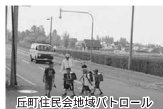
丘町住民会地域パトロール