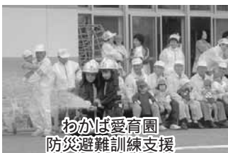
わかば愛育園 防災避難訓練支援