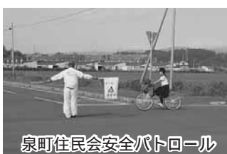
泉町住民会安全パトロール