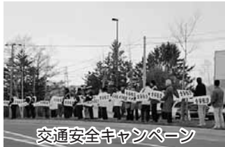
交通安全キャンペーン

交通安全部 交通安全指導員14名・交通安全教育指導員3名、地域安全部 地域安全活動推進員13名、女性部 12班117名(の3部が活動しています)。 登下校時の交通安全指導やパトライト作戦、街頭啓発、防犯パトロール、新入学児童の交通安全指導、「ななかまど」発行などを実施しています。