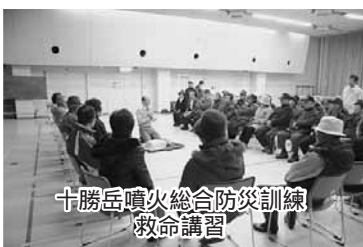
十勝岳噴火総合防災訓練 救命講習

冬に十勝岳が噴火し泥流が発生したと想定して実施し、平成21年度は225名が参加しました。各地域で決められた避難所での避難訓練を行いました。自衛隊などによる救助救出訓練などを実施しました。