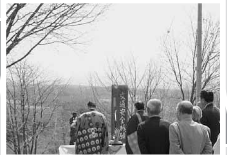
5月11日 春の交通安全祈願会

人口 11,843人 (- 8) 男 5,929人 (- 5) 女 5,914人 (- 3) 世帯 5,246世帯 (+ 2)