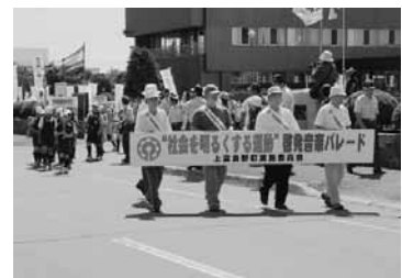
<昨年のパレードの様子>