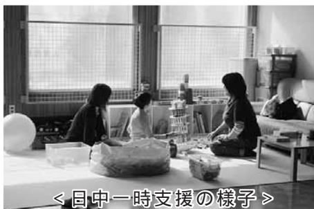
< 日中一時支援の様子 >

●日中一時支援事業 障がいを持つ児童の居場所を提供し ます。学校が終わった後や休みの日な どに預かります。 障がい児の社会性を育むことや、親 の負担を軽減し、働く時間などを持つ ことを目的に行います。 ●移動支援事業 旭川のショッピングモールでの買い 物・ボーリング、プール、体育館での トレーニングなど、趣味や買い物の外 出のお手伝いをします。 なないろニカラでは、地域で活躍す るボランティアの方を随時募集し、活 動します。