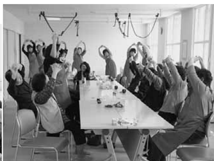
< 託老所の様子 >

棋等各自の趣味を楽しんでいます。 ●高齢者・障がい者等の生活支援 高齢者や障がい者等の家事支援やガ イドヘルパー、生活上の相談、話し相 手などを行っています。