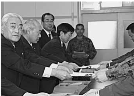
駐屯地現状維持の要望書提出(4月7日)