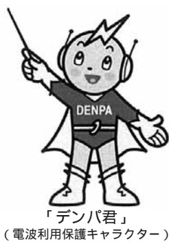
「デンパ君」 (電波利用保護キャラクター)