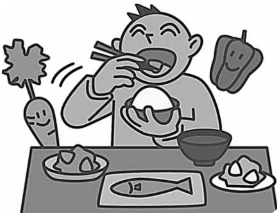
『早寝早起き朝ごはん』

私たちは寝ている間に体温と血糖値が下がり、低体温、低血糖状態で目が覚めます。朝食を食べると全身の細胞がウォーミングアップを開始し、体温が上がるのですが、朝食を抜くと午前中は低血糖状態が続きます。