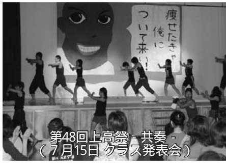
第48回上高祭・共奏 (7月15日 クラス発表会)