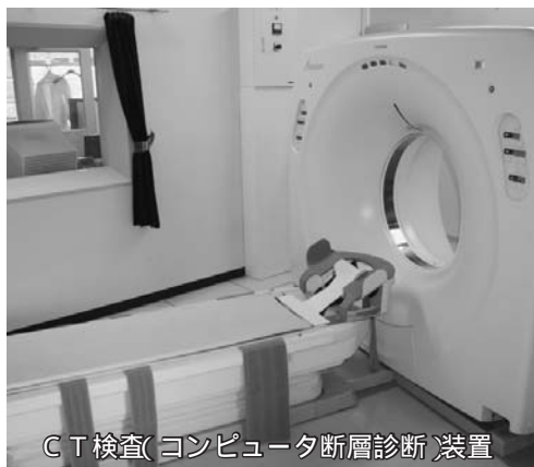
CT検査(コンピュータ断層診断)装置

大腸カメラ120件（約2割の方がポリプの切除）の検査も行っています。旭川など遠くの病院まで行かなくても、同じ検査を町立病院で実施できますので、ぜひご利用ください。