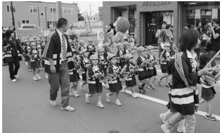
問合せ 上川南部消防事務組合北消防署 ☎2119

この時期、花火を楽しむ事が多くなりますが、遊び方を間違えたり、後始末をおこたると火災の原因となりますので、バケツ等に水を用意して、後始末をしっかり行いましょう！