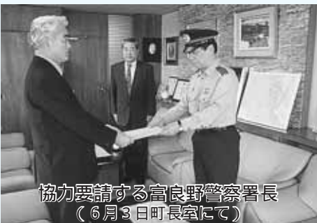
協力要請する富良野警察署長 (6月3日町長室にて)