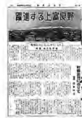
「躍進するかみふらの」創刊当時の広報かみふらの

皇太子殿下の婚約発表でミッチーブームがおきた昭和33年、「広報かみふらの」第1号がB5版の8Pで発行された