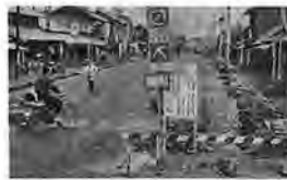
当時の舗装工事風景

上富良野町立病院基準看護と給食が承認された。本道の町村立病院では初めて、全看護給食を実施。当時は、内科・外科・小児科・産婦人科・放射線科・耳鼻咽喉科・整形外科・皮膚泌尿科の8診療科目があった。