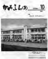
西小学校旧校舎との思い出。この写真は、下敷きにして児童に配られた。

10月 第497号 西小学校旧校舎との思い出。この写真は、下敷きにして児童に配られた。 カムローズ市訪問友好提携15周年記念に参加し、友情の絆を深める。