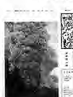
37年目の大噴煙をあげる十勝岳