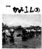
豊作を願って田植え

現在の「広報かみふらの」のデザインとなっているかみふらのの文字が、この号からお目見え。この文字は昭和46年の町勢要覧で使われた文字、デザインがよかったので、以降広報紙の顔となった。