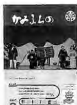
開基100年記念式典「プロローグ」

9月 第472号 上富良野百年史発刊。 11月 第462号 上富良野開拓記念館11月9日オープン