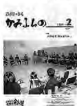
なかよしサミット開催

2月 第477号 3月町民ポスト町内5か所に設置。 4月第4次総合計画がスタート。 5月 第480号 クリーンセンター稼働開始。 9月 第484号 イトーヨーカドー女子バレーボールチーム初の合宿。