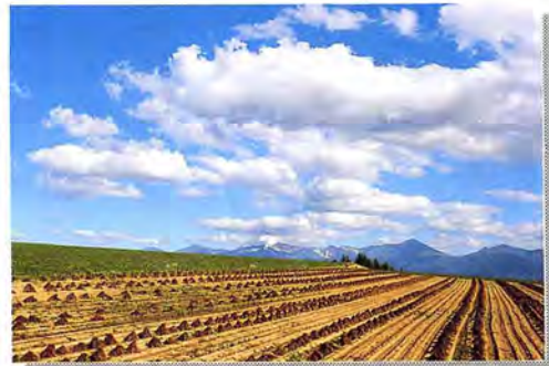
「秋晴れ」 山品 岩夫