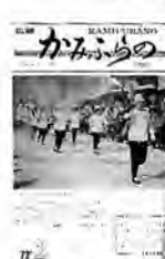
上富良野市街を聖火がゆく