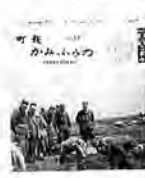
自衛隊さんの田植え援農作業