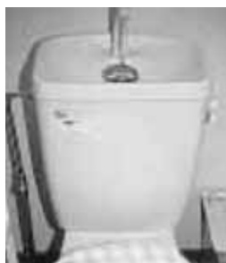
合併処理浄化槽整備事業 2,920万円