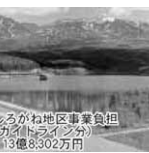
国営しろがね地区事業負担 (ガイドライン分) 13億8,302万円

答 数年前から入居者と協議を重ねていたが、合意には至っていない。引き続き協議を重ね、入居者の理解