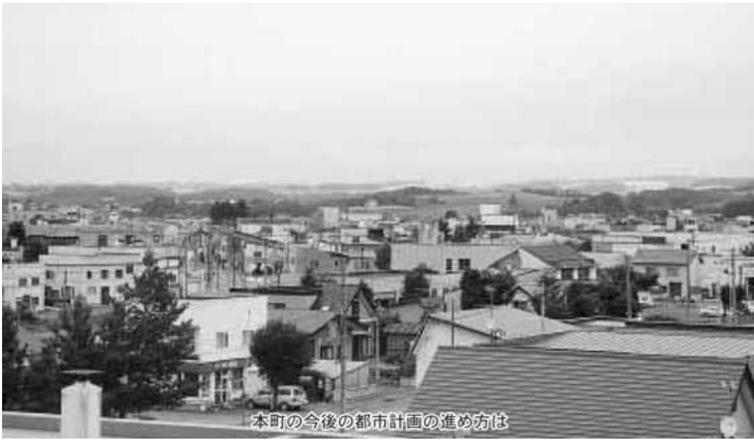
本町の今後の都市計画の進め方は