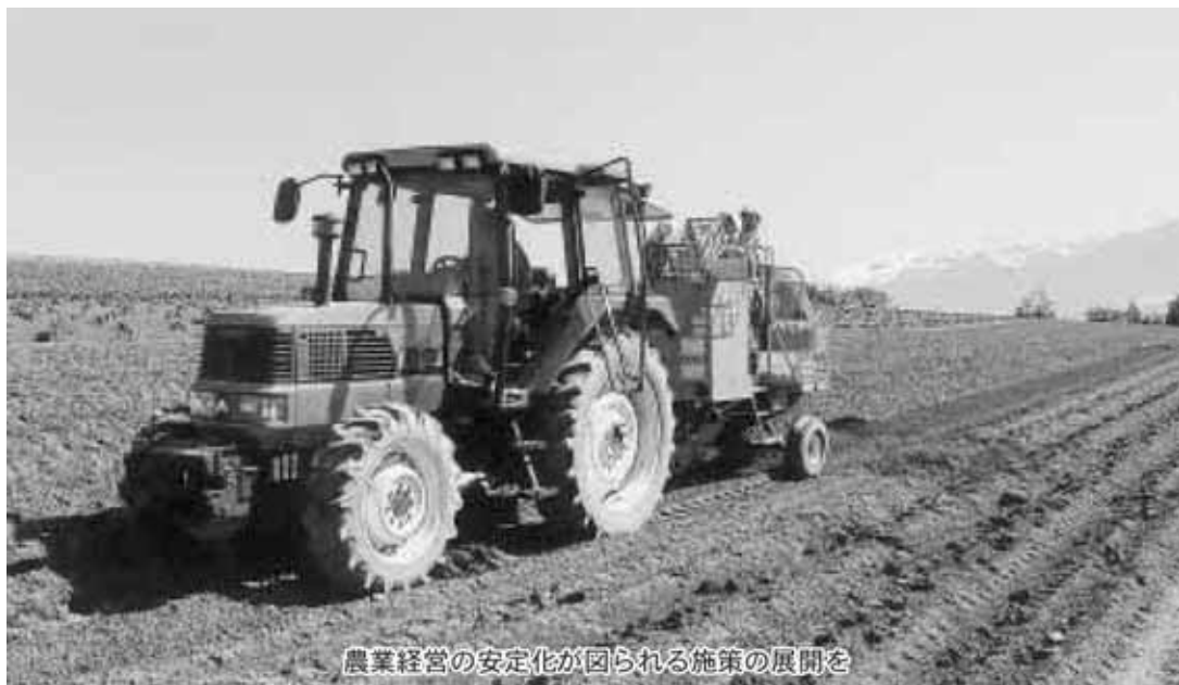
農業経営の安定化が図られる施策の展開を