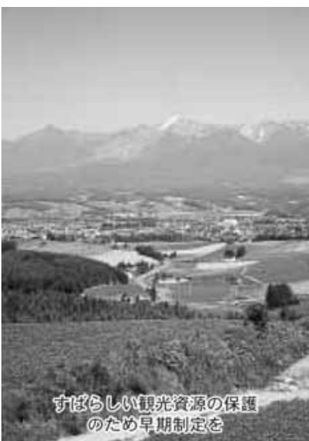
すばらしい観光資源の保護のため早期制定を