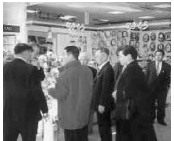
複合施設内の「プロspa6」を視察する議員

今回調査した両町共に再開発に取り組みをした経緯は、郊外での大型量販店の進出と宅地造成による住宅の建設、商店の後継者不足と空き店舗・空き地の増加による商店街と市街地の衰退が原因として上げられる。 町に賑わいを取り戻し、購買力を高めるため商業者と行政が連携して、店舗の集積、住宅建設、公共施設の配置などによる居住環境の整備と人が集まり憩える場所の設置が進められていた。それらと同時に、各種のイベント、研修会学習会への参加助成など賑わいを取り戻すためのソフト事業への支援も行なわれていた。 本町においても、大型量販店の進出、農協の合併とJAスーパーの移転、中心地商店の閉店で商店街地域は空洞化し賑わいを失ってきている。この状況を打破するためには、恒常的に人が集まり賑わう施設の整備が必要となっているので、商業者の自発的な取り組みはもとより、その取り組みに対して行政も支援していくことが必要である。