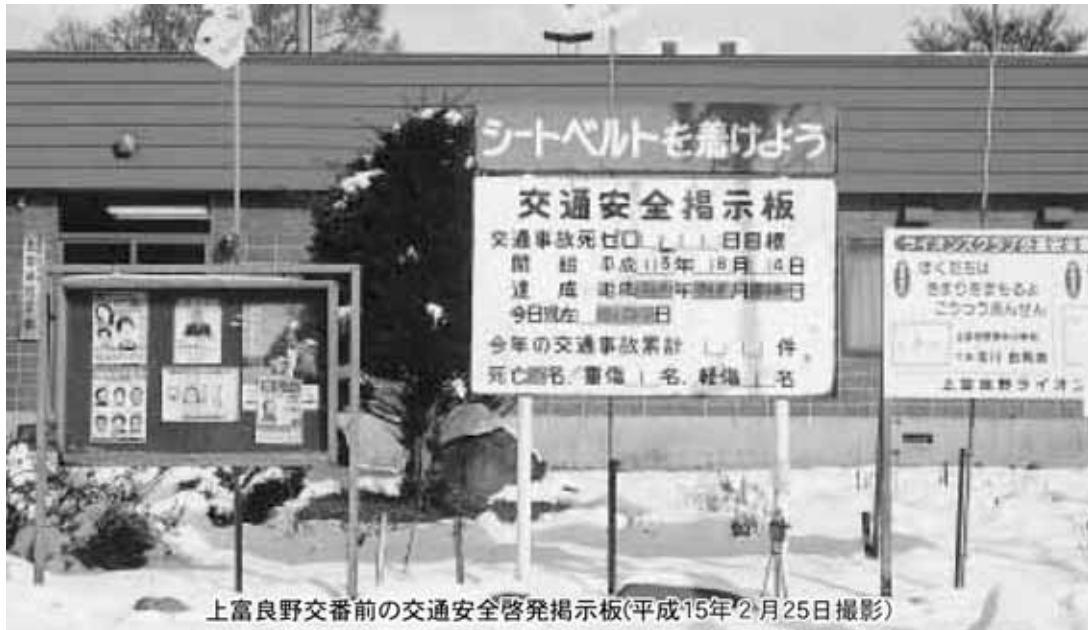
上富良野交番前の交通安全啓発掲示板(平成15年2月25日撮影)

交通安全防止対策について 問 交通事故死ゼロを目標にし、警察、交通安全協会等の関係機関がその取り組みを行い、交通安全運動を家庭や地域・職場から推進されているが、昭和52年から本年3月まで、上富良野町内で交通事故死が43件発生し、51名の方が死亡され、また、平成13年度の上富良野交番取扱いの交通事故等は376件発生している。