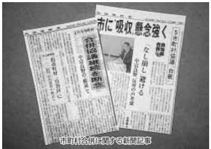
市町村合併に関する新聞記事

両町議員会は、広域行政推進と財政改革に向け共通案件について協議する。(例 火葬場、消防庁舎)年1回の交流研修会でなく両議員会の可能な範囲で開催し、共通事項の検討協議とその実現にお互い汗を流す。