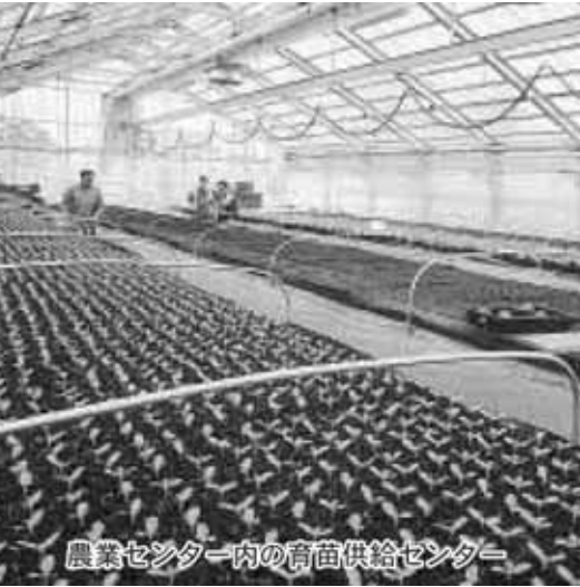
農業センター内の育苗供給センター

平成15年度は、長ネギ、メロン、アスパラ、トマトなど12品目、合計約300万本の供給予定です。