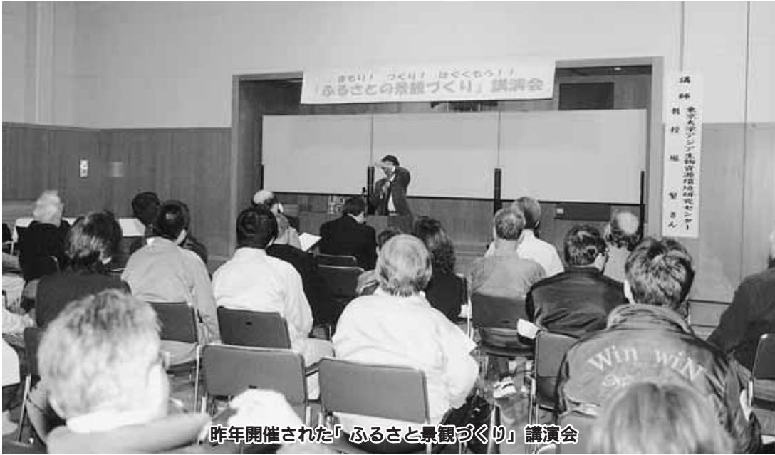
昨年開催された「ふるさと景観づくり」講演会