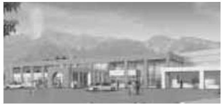
保健福祉総合センター建設 7億1,769万円