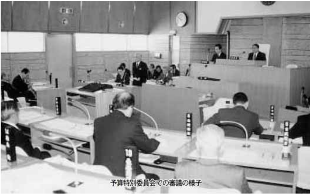
予算特別委員会での審議の様子