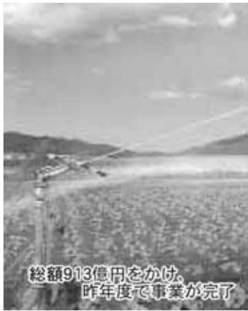
総額913億円をかけ、昨年度で事業が完了

国営土地改良事業（しろがね地区）は昭和45年に美瑛町において採択され、昭和48年の計画変更において、上富良野町、中富良野町が事業に参加し、ダム建設、道路整備、排水路整備、農地造成、区画整理、畑かん施設等の整備を30年以上の歳月と913億円の事業費をかけて施工し、平成14年度完了しました。 このことにより、地域の農業基盤整備の充実を図るとともに、農業の近代化と生産性の向上により、農業経営の安定化を図ることを目的としたものです。