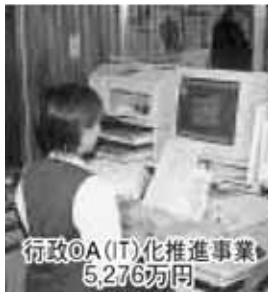
行政OA(IT)化推進事業 5,276万円