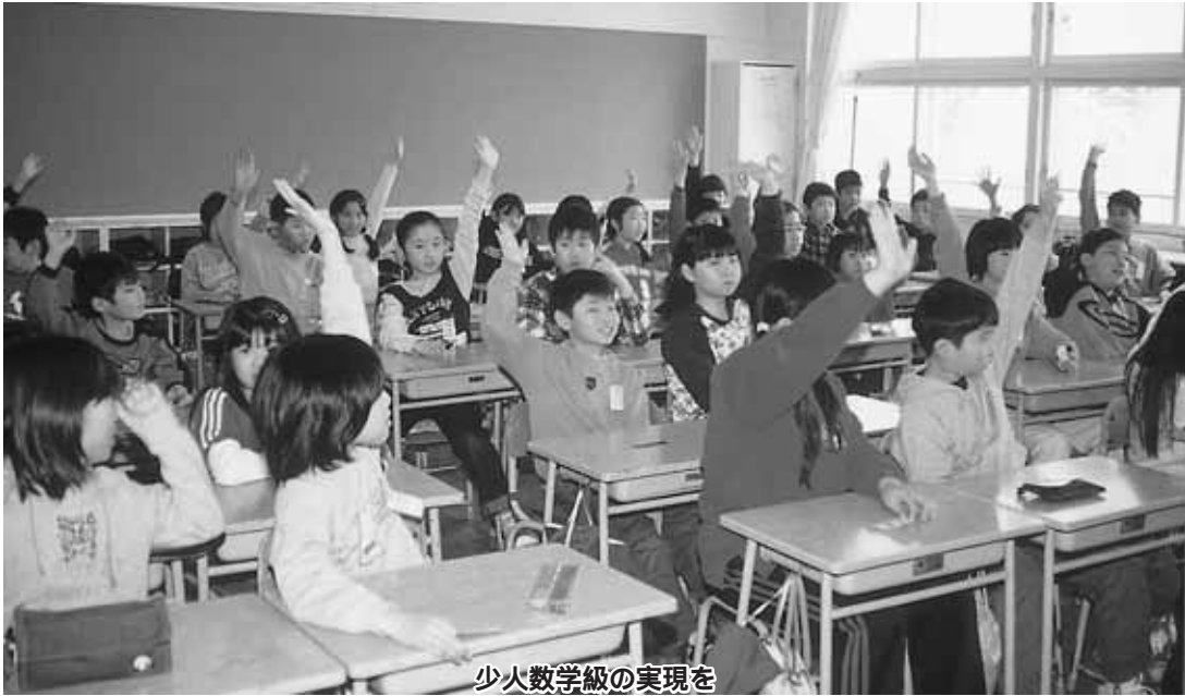
少人数学級の実現を