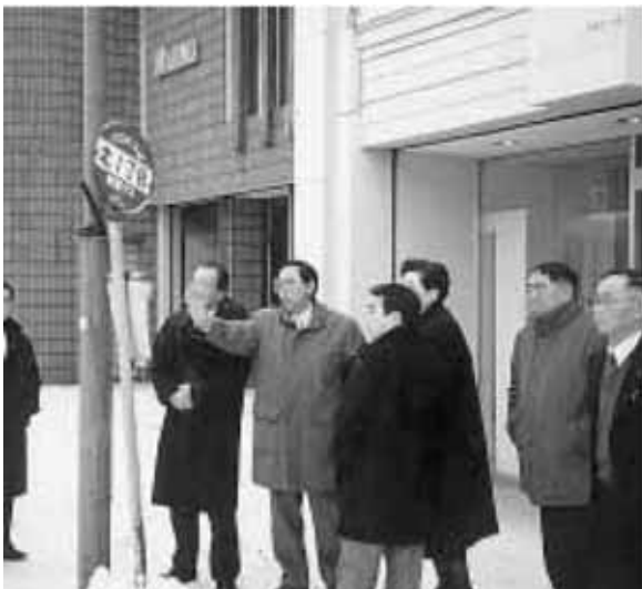
中心市街地活性化基本計画を策定し事業を推進

美幌駅に併設され、旧交通記念館を改修し、ターミナル物産センターとして、美幌町を中心とした物産の紹介と宣伝や新しい物産品と特産品開発の展示・販売・実習コーナーを設け物産振興の拠点施設となっている。駅利用者の利便性の向上を図るため観光情報提供・休憩コーナーも設置して、美幌町物産協会が運営し利用されている。