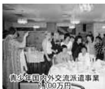
青少年国内外交流派遣事業 1,100万円