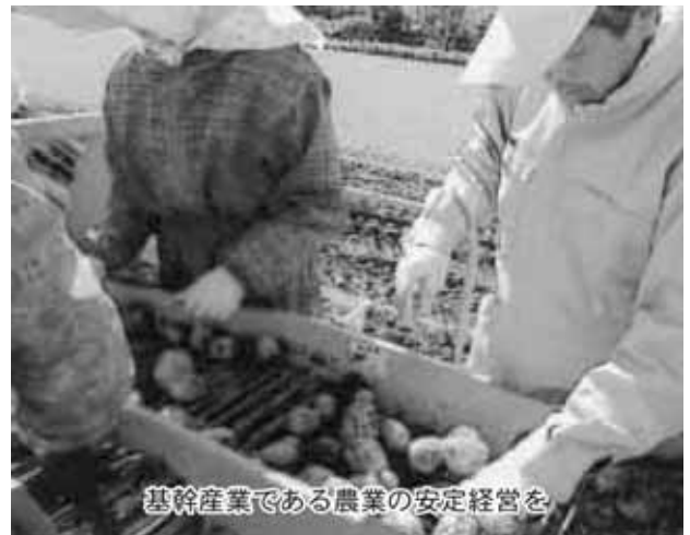
基幹産業である農業の安定経営を

そういう状況の中で議会としても、本年度から国営事業の償還が始まることなどから、今後農業に対して、行政がどのような施策をどの程度まで展開するのがよいか慎重な審議を行い、予算特別委員会で国営事業、農業センターに対して審査意見を付して適正な予算執行を求めたところです。