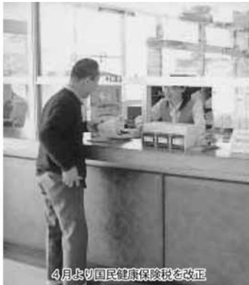
4月より国民健康保険税を改正

0円それぞれ引き上げるものです。介護分については、所得割を0.15%、賦課限度額を100000円それぞれ引き上げるものです。このことにより一世帯平均で約70000円保険税が上がることとなります。 条例の審議においては、税率改正の必要性、基金の支消額、改正時期の問題等の質疑が行われ、その後賛成、反対の立場でそれぞれ5名ずつの討論を行い、起立採決の結果、賛成多数で原案通り可決しました。