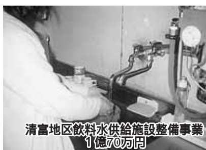
清富地区飲料水供給施設整備事業 1億70万円