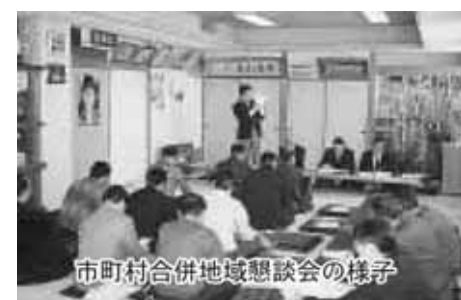
市町村合併地域懇談会の様子

設置、警察官が差し替えを行っているが、交番定員が減った等の諸種の事情で未使用状態にある。 今後、補修を加え、交番等の関係機関と協議を行い交通安全意識啓発のため、効果的な利用の検討を進めていく。 市町村合併について 問 市町村合併について町民の皆様に情報を提供し、多くの意見を聞く開催した「町民トーク」は13会場で、141名出席で、一会場11人弱の町民参加であった。 町の将来を考える大きな課題なのに非常に残念である。「町民トーク」への参加呼びかけ、周知方法が事務的であって、町民の関心を高め、心を動かす内容と方法に欠けていたのでは。 町長 住民会長会議で参加協力要請を依頼するとともに、各種団体の代表者、住民会長に文書、電話にて周知を図った。また、広報お知らせ版や防災無線による案内を行った。