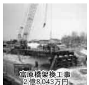
富原橋架換工事 2億8,043万円