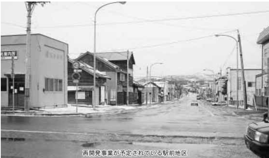
再開発事業が予定されている駅前地区