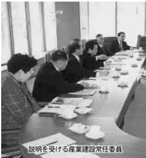
説明を受ける産業建設常任委員

音更六新地区を重点整備地区として、町の新しい顔づくりとして事業に着手し、中心市街地として複合施設と共同住宅の整備を進めた。事業は道路を挟んだ2地区からなり、東地区は商業施設と公共施設を併せもつ3階建て複合施設の建設と車社会に対応した駐車場が整備されていた。複合施設の1階は、近隣住民の買い物の利便と憩いの場を提供するものとして生鮮食品を扱うスーパーマーケット、書店、写真店、食堂、休憩所があり、2階3階には、商工会事務所及び図書館、集会施設、ことばの教室、母子通園センターなどの公共施設があり、住民生活に密接した施設整備がされていた。西地区は、まちなか居住による中心市街地活性化を目指して高齢者・身障者にも配慮したバリアフリーの3階建て共同住宅が2棟24戸建設されていた。今回行なわれた市街地再開発事業は、民間施行者の組織を設立して行なわれ、町は公共施設のスペースと共同住宅2棟を施設完成後に買取り、供用している。