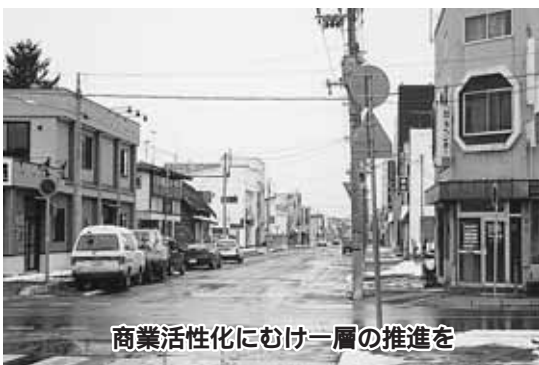
商業活性化にむけ一層の推進を

出来る。自己資金が半分なければ実行できない。自己資金はないがやりたいという方が多いと思う、その点町長はどのように考えるか。 町長 この制度の利用に当たっては補助金以外にも自己資金が必要となるため、町商工会や地元金融機関との連携を図り、町の中小企業融資や他の制度資金など低利資金の活用をしながら、当補助制度の一層の普及啓蒙に努めていきたい。