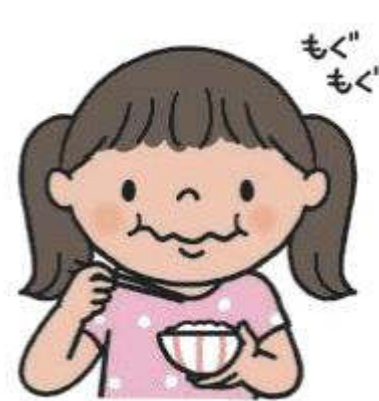
よくかんで食べる

歯についた食べかすは、むし歯の原因になるので、ていねいに歯のよごれをおとしましょう。