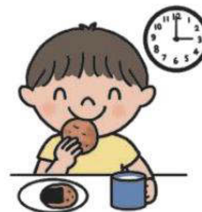
時間をきめて食べる