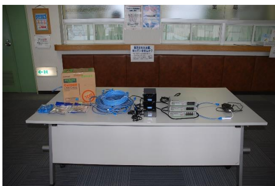
LANケーブル、コネクタ、HUB、 拡張通信ポート