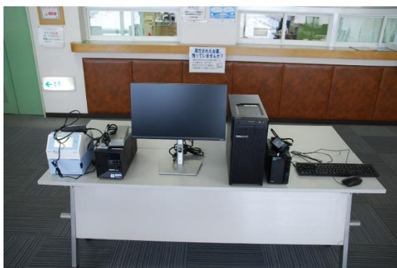
サーバー 1台、ラベルプリンタ1台 無停電装置 1台