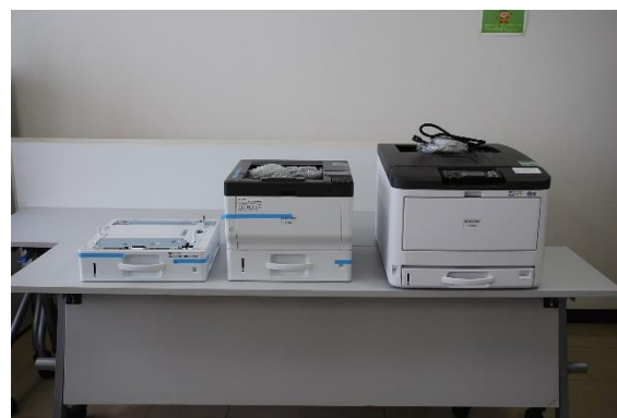
検査室用プリンター 2台