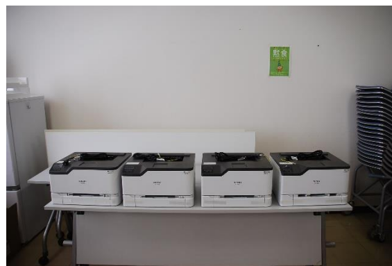
各部署配置用プリンター 4台