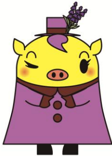
上富良野町ご当地キャラクター

人口 9,460 人 ( 5,089 世帯 ) (2026 年 02 月末現在)