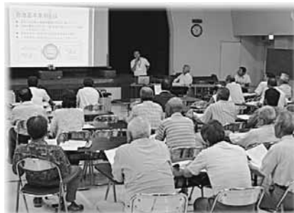
住民会長・町内会長町政懇談会での自治基本条例説明の様子(7月15日)

*団体・グループなど、5人以上が集まれば、ぜひ「出前講座」をご利用ください。町の職員が講師になり、自治基本条例について説明します。