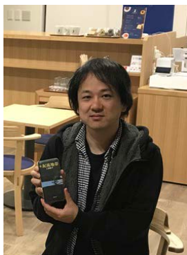
プレロケハンで上富良野町や三浦綾子記念文学館を訪れた際の柴山監督 (2019年10月)

映画業界にも大きな影を落としたコロナ禍ですが、粘り強く、一歩ずつ前進しています。実現に向けて多大な尽力をいただいている映画監督の柴山健次さんよりメッセージをいただきました。