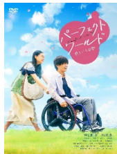
映画『パーフェクトワールド 君という奇跡』 主演：岩田剛典、杉咲花 監督：柴山健次 原作：有賀リエ 発売元・販売元：松竹 価格 DVD4,180円(税込) ©2018「パーフェクトワールド」製作委員会 ©有賀リエ/講談社