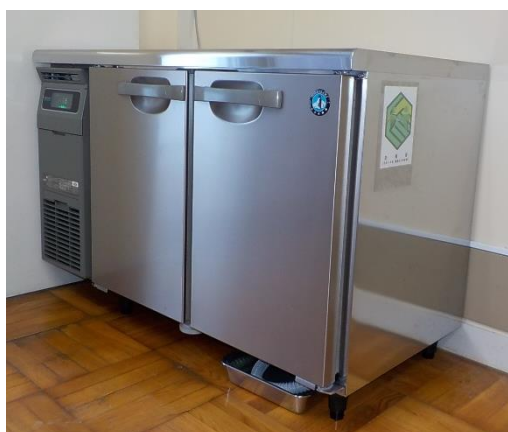
(上富良野西小学校)