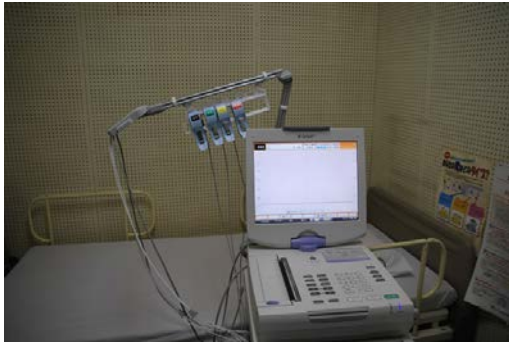
※シリンジポンプ 5台