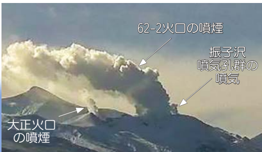
北西側から見た火口周辺の状況

62・2火口付近に設置された前十勝西の傾斜計では、今期間は微動や地震増加と同期した傾斜変動は観測されていません。山体深部の動きを示す地殻変動は観測されていません。