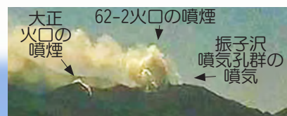
北西側から見た火口周辺の状況